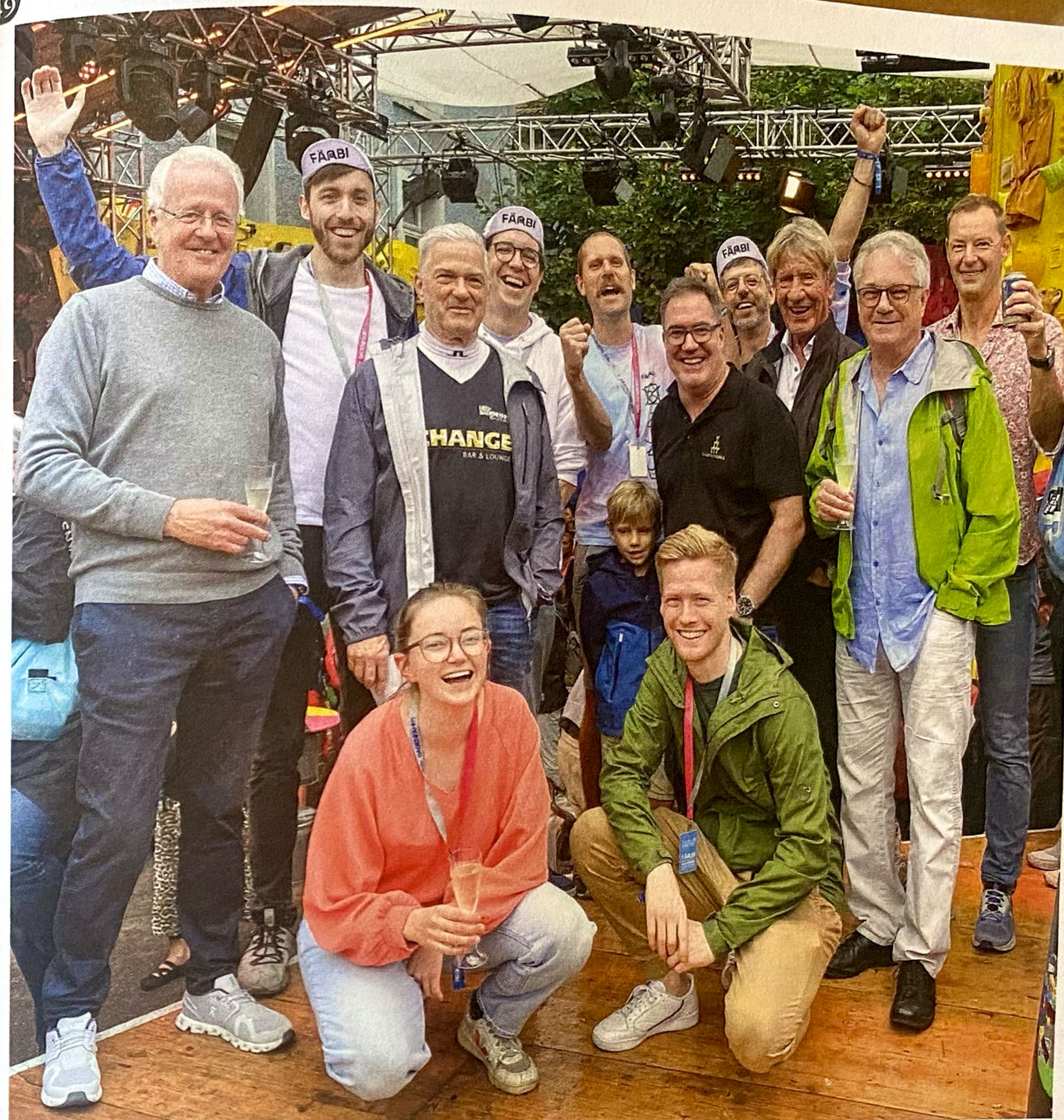
«Eine Delegation von UKURBA informiert das OK FÄRBI, die Gewinner des UKURBA-Preises 2023». Herzliche Gratulation.

Das Musical «The Copyright Girl» von François Ruedin aus Freienwil wurde im Frühjahr 2023 aufgeführt. Die Idee wurde mit Profi-Darstellern und Liveband realisiert und im ehemaligen Kino Elite in Wettingen auf die Bühne gebracht. 2013/2014 lancierte UKURBA den Projektwettbewerb «Kunst am Bau Trafo II». Als Siegerprojekt wurde «die vier Jahreszeiten» von Ugo Rondinone